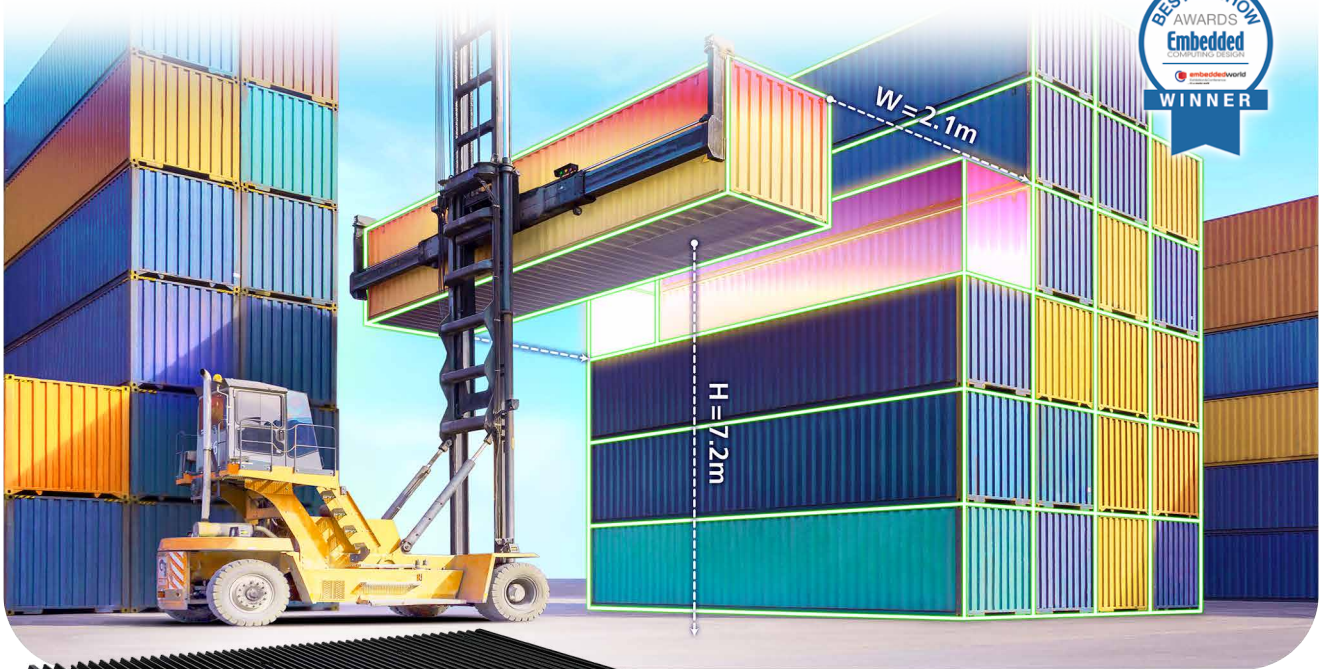
▲ カーゴの荷役自動化